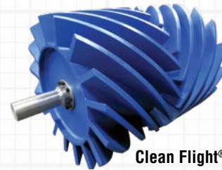
Clean Flight® Wing