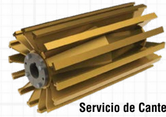
Servicio de Cantera en AR