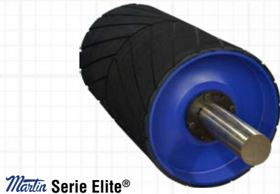
Martin Serie Elite®